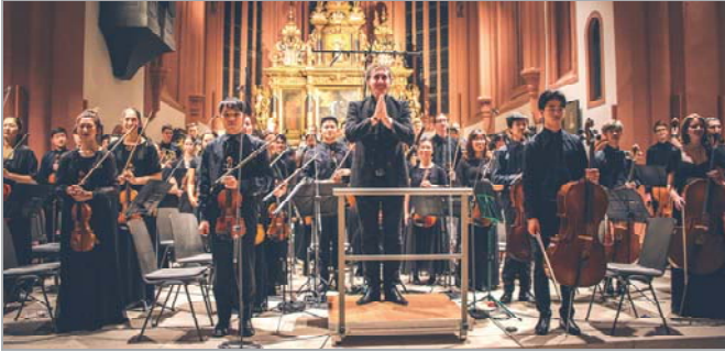
Das Auckland Youth Orchestra setzte den bewegenden Schlusspunkt des 68. Festivals.

Immensen Publikumserfolg in Speinshart und Bayreuth erzielte mit seinen Interpretationen großer Meister - Copland, Haydn, Sibelius, Elgar - auch das vielfach ausgezeichnete neuseeländische Auckland Youth Orchestra, welches dem Festival ein bewegendes und gutes Ende gab. Dass der „Young Euro Classic“ Teilnehmer hier beim Abschlusskonzert mit einem Werk von Jean Sibelius, dem Mitbegründer des Festivals aus dem Jahr 1950, den glanzvollen Schlusspunkt setzte, zählte sicher zu den ergreifendsten Momenten.