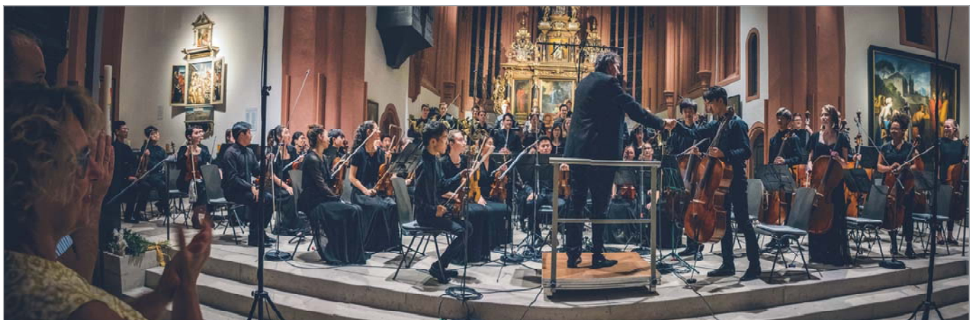
Das Auckland Youth Orchestra spielte unter der Leitung von Antun Poljanich ein bewegendes Abschlusskonzert des 68. Festival junger Künstler Bayreuth. Der Young Euro Classic Teilnehmer 2018 wurde dafür vom Bayreuther Publikum in der Stadtkirche mit nicht mehr enden wollenden Standing Ovationen bedacht.