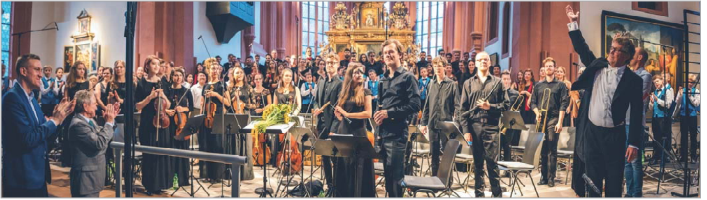
Tosender Applaus für Claudio Monteverdis Marienvesper, einem farbenprächtigen und stimmächtigen Friedenskonzert mit 140 Mitwirkenden unter der Gesamtleitung von Fred Sjöberg mit dem Knabenchor „Jazeps Medins“ aus Riga, dem Novi Sad Kammerchor aus Serbien, dem Chor der Mazedonischen Universität Thessaloniki - Griechenland, dem Festival-barockorchester und insgesamt sieben Solo-Stimmen.