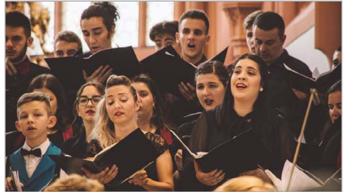
Die Marienvesper, ein farbenprächtiges und stimmächtiges Friedenskonzert mit 140 Mitwirkenden.

dem Festivalbarockorchester und insgesamt sieben Solo-Stimmen ebenfalls für einen großen Meister des Barock: Claudio Monteverdi. Dessen Marienvesper, Venedig 1610, ist Papst Paul V. gewidmet und ein Monument der katholischen Gegenreformation im 17. Jahrhundert. John Eliot Gardiner (Monteverdi Choir & Orchestra) war davon überzeugt, dass sich Monteverdi